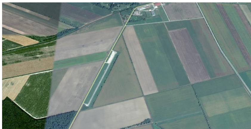
Lokalna zračna luka 'Čađavica'