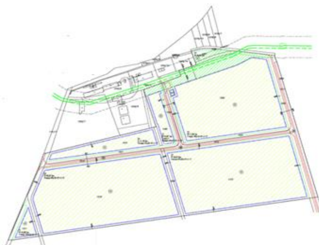
Tlocrt Ind. Zone čađavica

Primjedba: Proizvodnja i prerada mesa po Halal- i Kosher-postupku